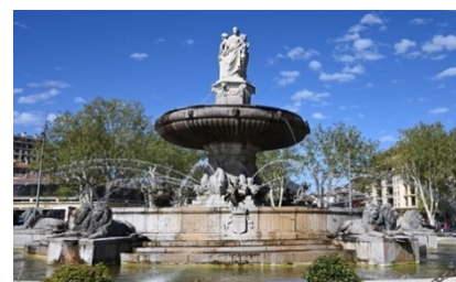
Fontaine de la Rotonde

Place de l'Hôtel de Ville avec le beffroi et son horloge, cour de la mairie.