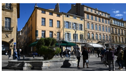
Fontaine Moussue eau à 18°

Nous entrons dans le quartier médiéval où les rues, contrairement au quartier Mazarin qui sont en angle droit, ici ce sont des ruelles étroites et tortueuses, rue Esquicho-Coude !